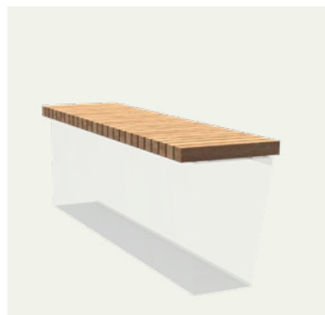
SITZ IN DER BREITE