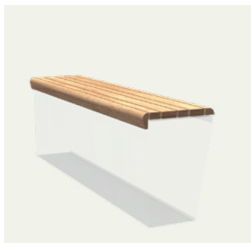
SITZ IN DER LANGE

Eine vollständige Übersicht aller Modelle und produktspezifischen Optionen finden Sie unter www.adezz.com