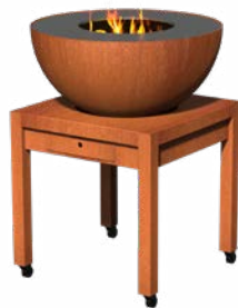
FORNO BULL BTC 1