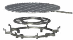
FORNO BULL BTC 1A