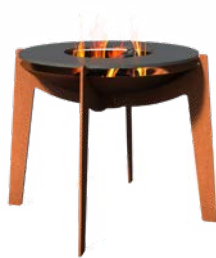
COSA + BAKPLAAT