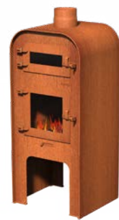
GAP + PIZZA