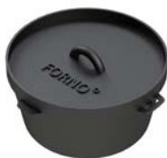
FORNO GIETIJZEREN PAN