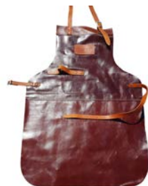
FORNO LEDEREN SCHORT