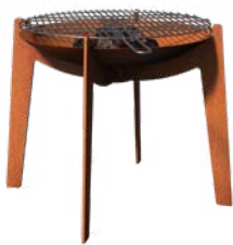
COSA + GRILL