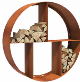
STOCKAGE DE BOIS