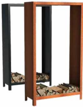
STOCKAGE DE BOIS

Pour un aperçu complet de tous les modèles et des options spécifiques au produit, visitez www.forno.nl