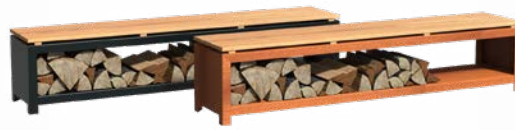
STOCKAGE AVEC SIÈGE