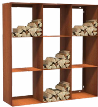
STOCKAGE DE BOIS