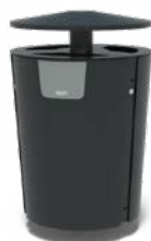
DUNC 3 STROMINGEN 60L