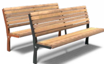
GRO 1500 AVEC DOS