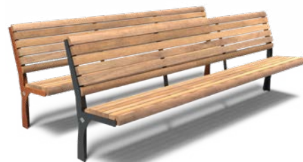
GRO 2300 AVEC DOS