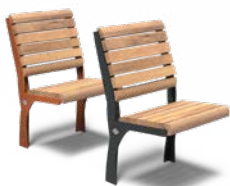
GRO 500 AVEC DOS

Pour un aperçu complet de tous les modèles et des options spécifiques au produit, visitez www.furns.com .