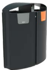
GRO 2 ENTRÉES 100L