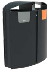
GRO 2 STRÖMUNGEN 100L