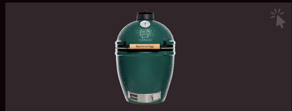
BIG GREEN EGG LARGE