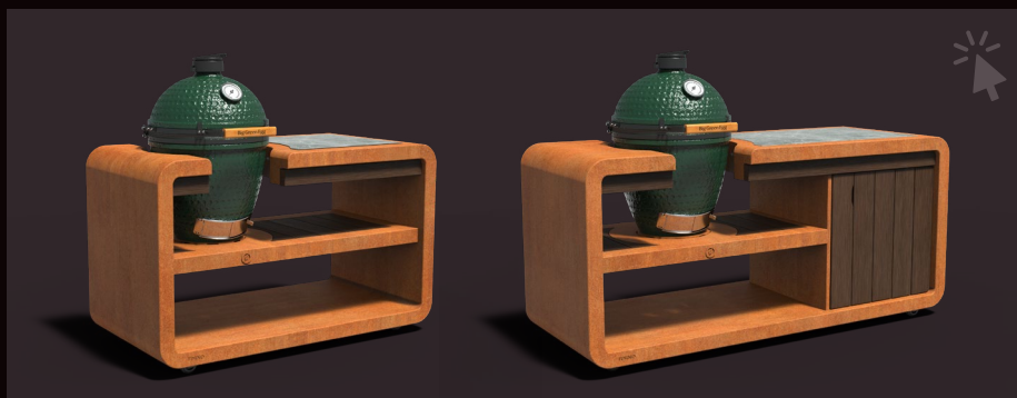
KAMADO STATION 1500 & 2000 CORTENSTAAL