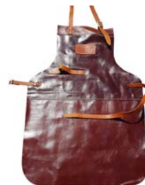
FORNO LEDEREN SCHORT