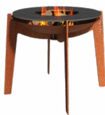
COSA + BAKPLAAT