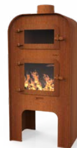
GAP + PIZZA