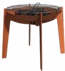
COSA + GRILL