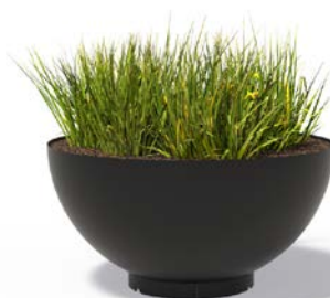
BOCCA (GECOAT STAAL)