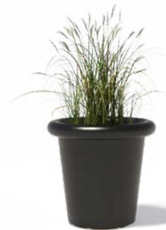
TUBE (GECOAT STAAL)