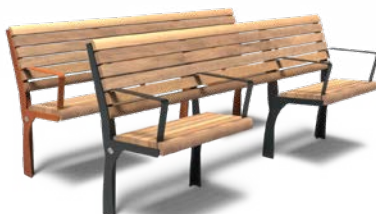
GRO 2000 SENIoren