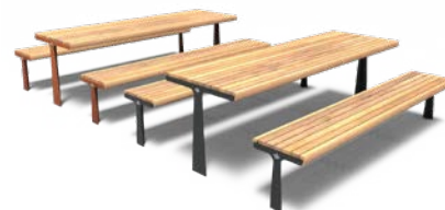
GRO 2300 COMBINATION