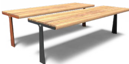
GRO 2300 TISCH