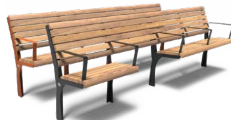
GRO 2600 SENIoren