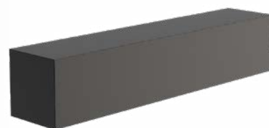
SOKKEL RECHTHOEK LAAG ALUMINIUM