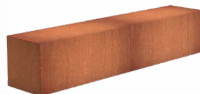
SOKKEL RECHTHOEK LAAG CORTEN