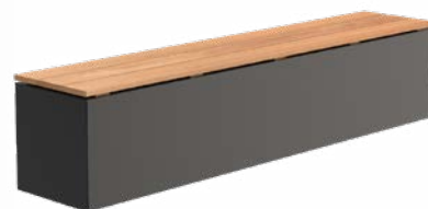
SOKKEL ALUMINIUM MET ZITTING