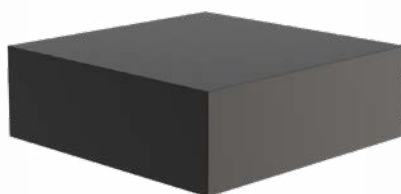
SOKKEL VIERKANT LAAG ALUMINIUM