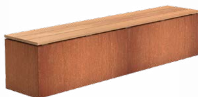
SOKKEL CORTEN MET ZITTING