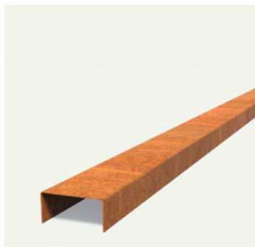
PROFILÉS DE RECOUVREMENT DROIT

Pour un aperçu complet de tous les modèles et des options spécifiques au produit, visitez www.adezz.com .