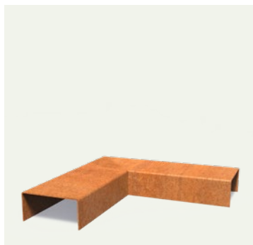
PROFILÉS DE RECOUVREMENT ANGLE